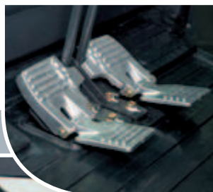
Nouvelles pédales de translation ergonomiques et repliables pour un confort accru