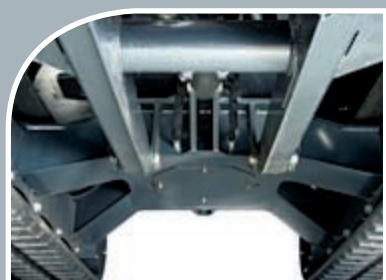
Le nouveau bâti de chenilles en X procure davantage de garde au sol et une meilleure évacuation des débris.

Le contacteur au pouce, placé sur le manipulateur gauche ①, présente un triple avantage par rapport à la commande par pédale classique : contrôle précis du déport de flèche, meilleure ergonomie et gain d'espace au plancher (et pour les jambes !).