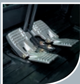
Les nouvelles pédales de translation ergonomiques en aluminium moulé permettent un contrôle souple et sûr de la machine.