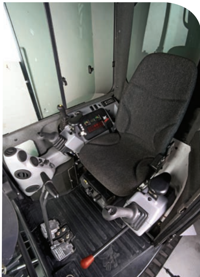
Nos ingénieurs ont pensé la cabine depuis l'intérieur en privilégiant le confort de l'opérateur. Résultat : une cabine extrêmement spacieuse.