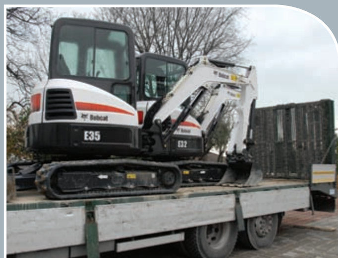
Compactes et faciles à transporter !