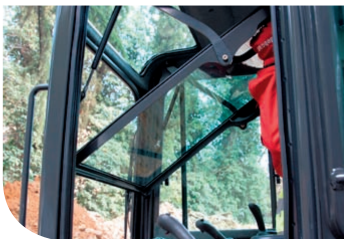
Profitez d'une vue d'ensemble : avec les mini-pelles E32 et E35, vous disposez d'une visibilité sur 360° !

Avec les mini-pelles E32 et E35, l'opérateur bénéficie d'une réduction encore plus poussée du niveau sonore, de la température et des vibrations grâce à l'évolution de nombreux composants : moteur, systèmes d'admission d'air, de refroidissement et d'échappement. La cabine offre en outre un poste de conduite plus spacieux et plus confortable, ainsi qu'une meilleure visibilité.