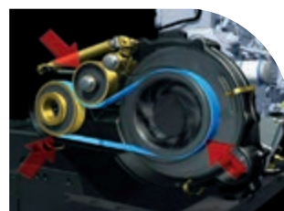
Transmission par courroie