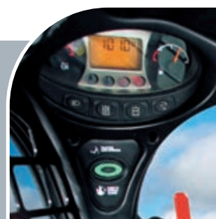
Tableau de bord gauche (standard)