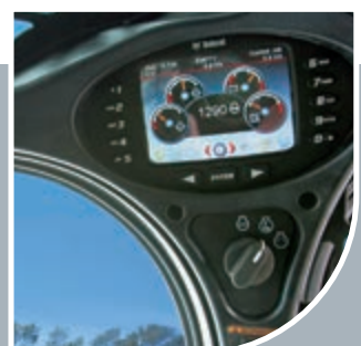
Tableau de bord droit Deluxe (option)